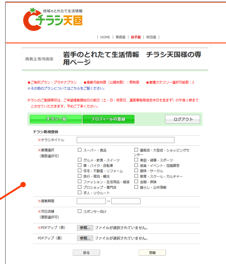
掲載主専用管理画面イメージ

管理画面ではチラシ登録の他、チラシ情報下に表示される企業・お店のプロフィール情報も登録・編集することができます。